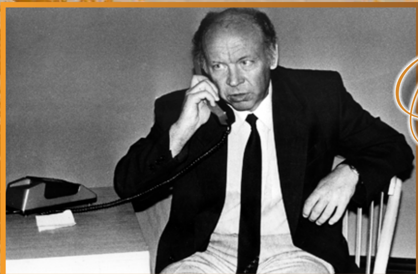
Телефон – главный инструмент руководителя