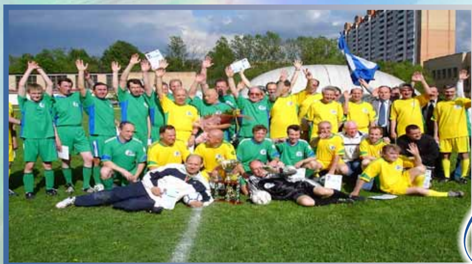
В футбол играют настоящие мужичины