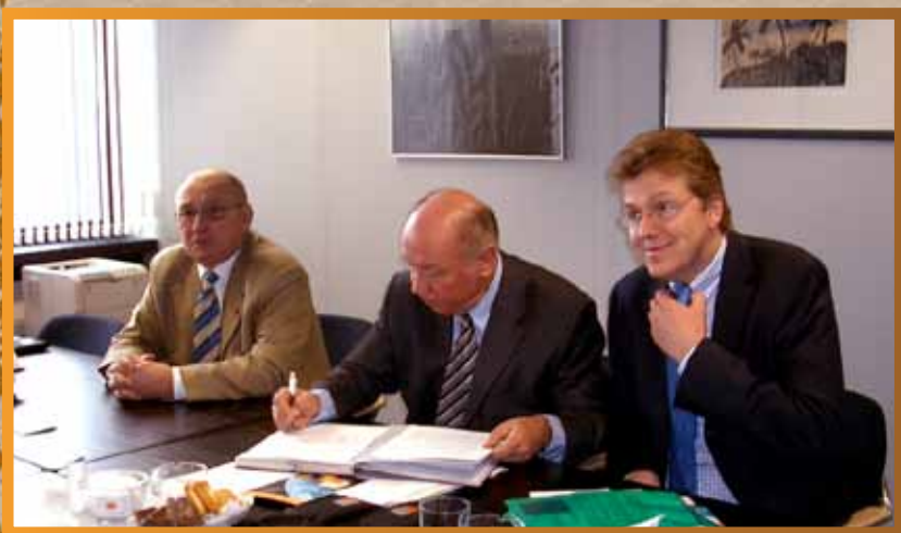
Рождение международной выставки WIRE Russia