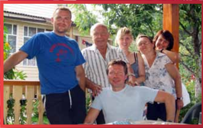
На работе хорошо, а на даче — лучше