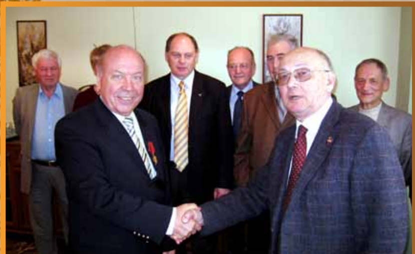
Поздравление с высокой правительственной наградой