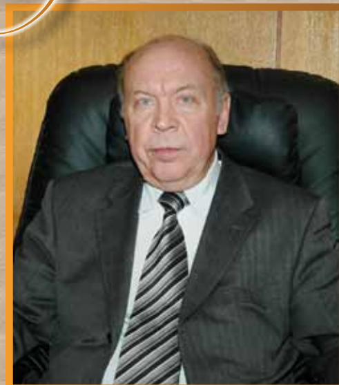
В рабочем кабинете