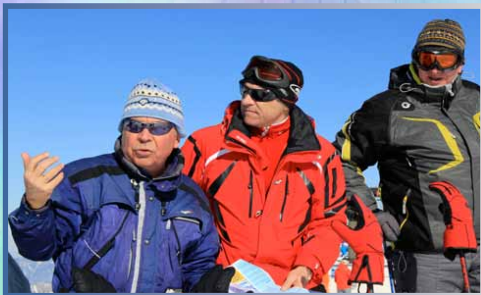
А вон та зорка, пожалуй, покруче будет