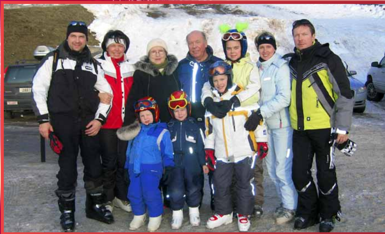
Три поколения счастливой семьи