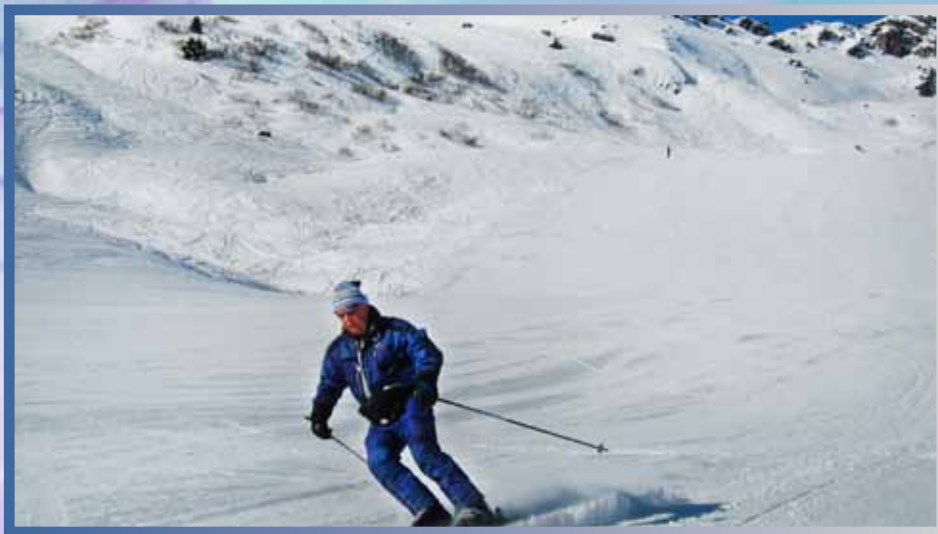
Лучше зор могут быть только зоры