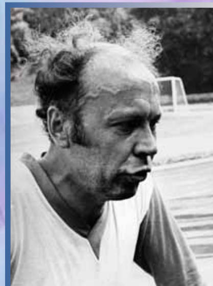
Футбол — дело серьезное